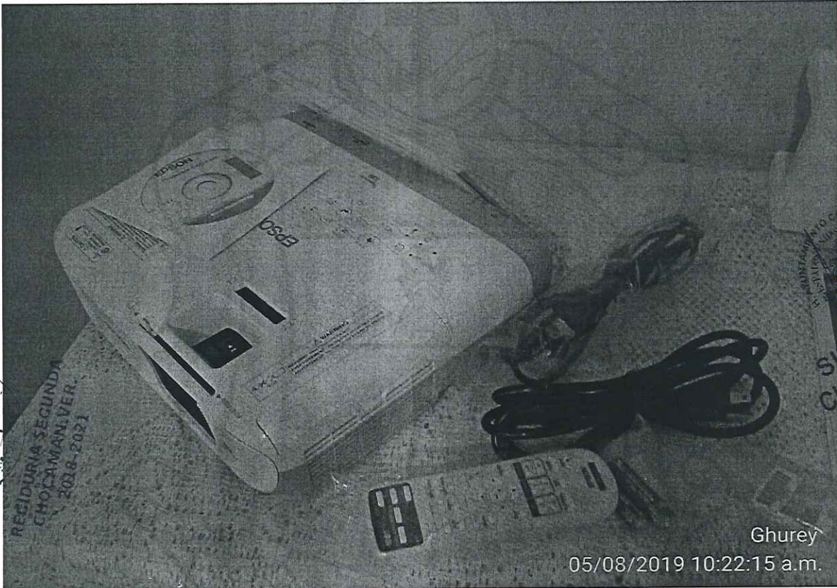
Proyector POWERLITE X39 XGA 3LCD